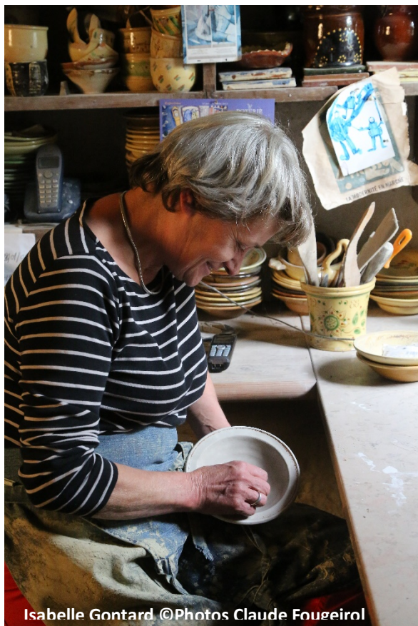
Isabelle Gontard